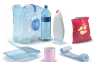
Emballages en plastique