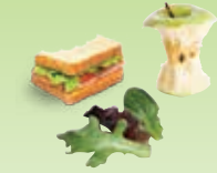
Restes de repas