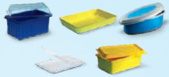
Barquettes et rapiers