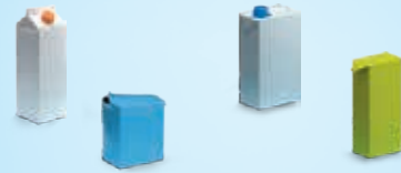
Lait, jus de fruits, crème fraîche, passata...