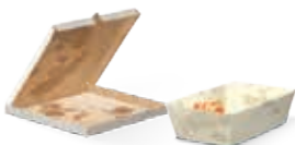
Papier et carton sale ou gras