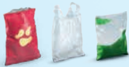
Sacs et sachets