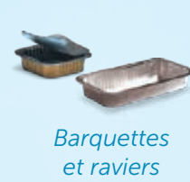
Barquettes et rapiers