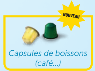
Capsules de boissons (café...)