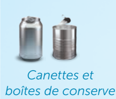
Canettes et boîtes de conserve