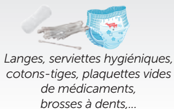
Langes, serviettes hygiéniques, cotons-tiges, plaquettes vides de médicaments, brosses à dents,...