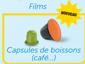
Capsules de boissons (café...)