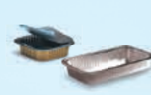
Bakjes en schaaltes