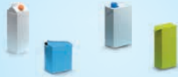
Melk, fruitsap, verse room, passata...