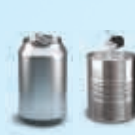
Drank- en conservenblikken