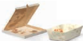
Vuil of vettig papier en karton