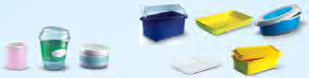
Schalen, Tiegel und Essensbehälter