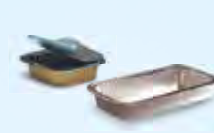
Schalen und Essensbehälter