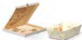
Verschmutztes oder fettiges Papier bzw. Karton