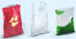
Beutel und Säcke