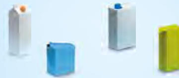
Milch, Fruchtsäfte, Sahne, Passata...