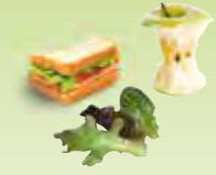
Reste von zubereiteten Mahlzeiten