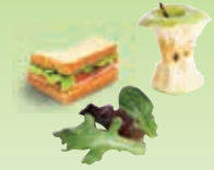
Reste von zubereiteten Mahlzeiten