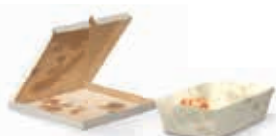
Verschmutztes oder fettiges Papier bzw. Karton