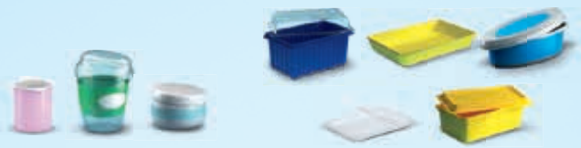
Schalen, Tiegel und Essensbehälter