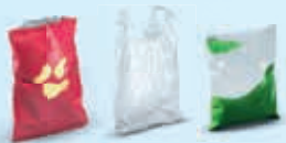
Beutel und Säcke