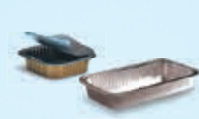
Schalen und Essensbehälter