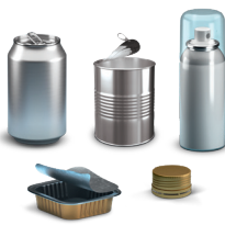
Embalagens de metal