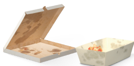
Papel e cartão sujo ou gorduroso