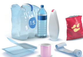
Embalagens de plástico