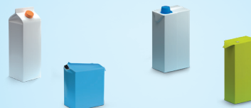
Leite, sumos de fruta, natas, passata...