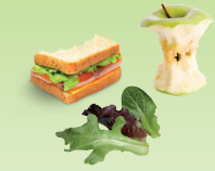
Restos de comida