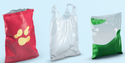
Sacos e saquetas