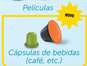
Cápsulas de bebidas (café, etc.)